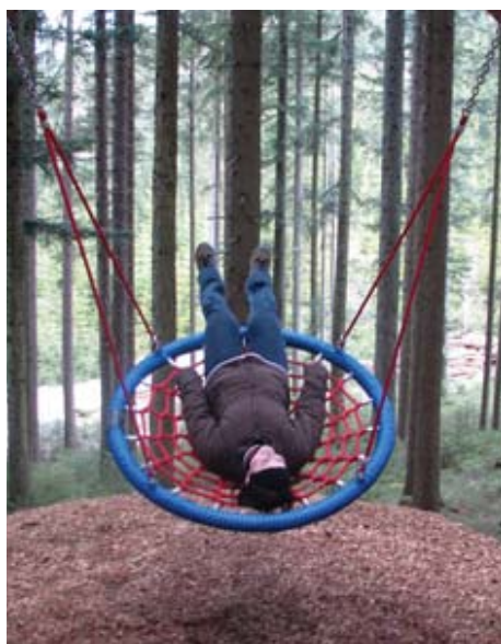
Malo drugačen stik z naravo

Interpretacija narave kot komunikacija idej in občutkov, pomaga ljudem razumeti več o naravi in samem sebi skozi izkušnje, vse to pa postaja učeča ponudba za obiskovalce, tudi osebe z omejenimi gibalnimi ali zaznavnimi sposobnostmi, v zaščitene naravnih območjih.