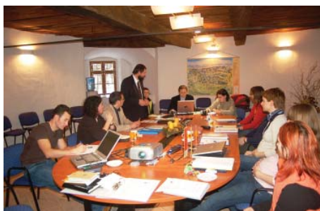
Uvodno srečanje projektnih partnerjev

V partnerskih državah je praksa interpretacije narave kot del ponudbe naravnih parkov dobro razvita. Z vključevanjem lokalnih prebivalcev v razvoj te ponudbe postaja čedalje bolj pomemben tudi prispevek h gospodarskemu razvoju območij. Avstrija in Nemčija sta razvili certificirani sistem usposabljanja vodnikov, ki izvajajo interpretacijo >