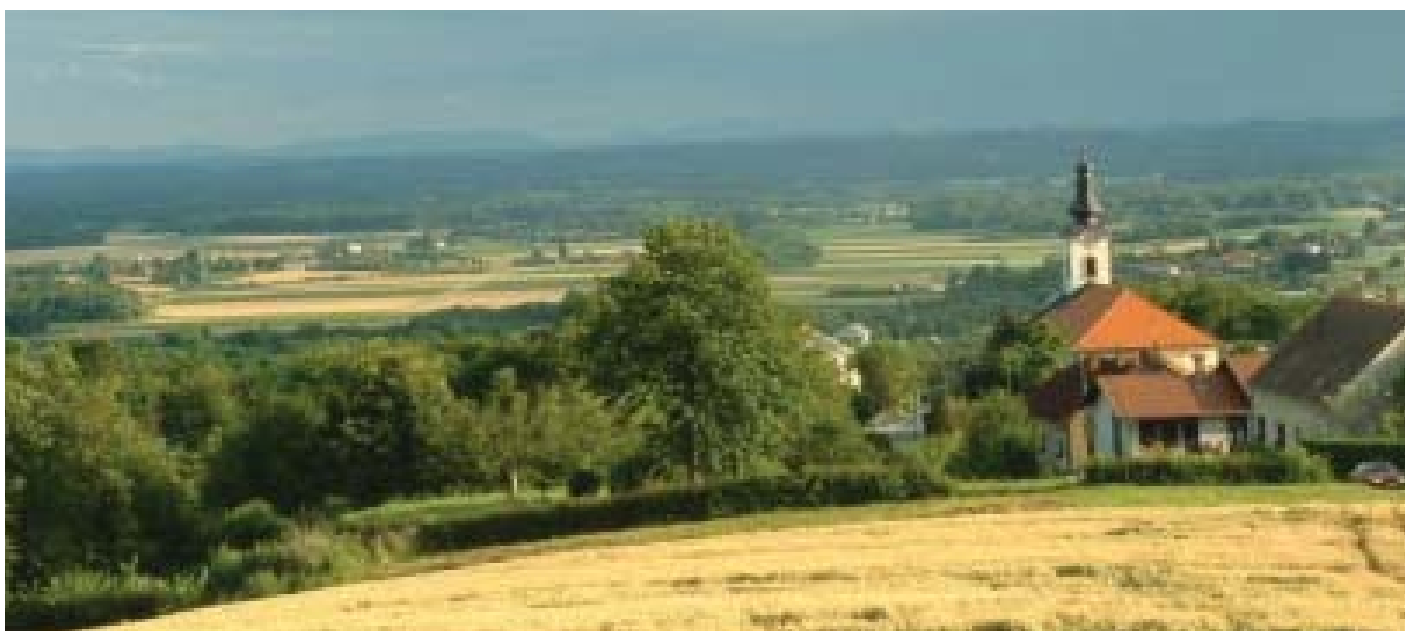
Pogled z Goriškega

Sočasno poteka analiza potreb po znanjih za interpretacijo narave pri obstoječih in potencialnih vodnikih v naravi. Rezultati nam bo v pomoč pri opredelitvi potrebnih znanj in veščin interpretatorja narave.