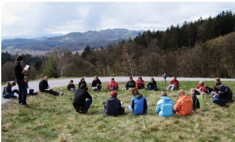
Usposabljanje vodnikov v Avstriji

narave in kulturne dediščine. S projektom želimo dobre prakse usposabljanja prenesti v Slovenijo ter jih skupno nadgraditi s temami skupnega interesa, kot so zdravje in interpretacija narave za osebe s posebnimi potrebami.