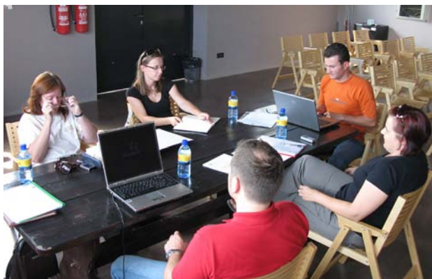
Julijsko srečanje slovenskih partnerjev