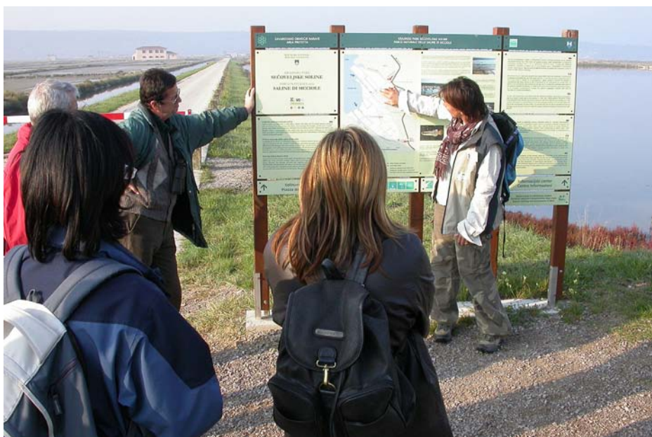
Vodenje po parku Seveljske soline

Primerjalna analiza izobraževanja vodnikov in izvajanja programov vodenja v naravi in interpretacije narave je prvi izdelek, v katerem predstavljamo in primerjamo obstoječe programe usposabljanja in prakso interpretacije narave v partnerskih državah Avstriji in Nemčiji. V obeh državah se izvajata certificirana programa izobraževanja vodnikov po naravi in kulturni krajini. V dokumentu so podrobno predstavljene vsebine in postopki za pridobitev kvalifikacije. Predstavljamo tudi zanimive primere ponudbe interpretacije narave ter nekaj informacij o aktivnostih naravnih parkov.